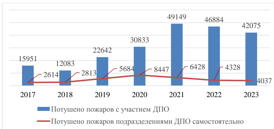
Рисунок 1. Участие подразделений ДПО в тушении пожаров на территории Российской Федерации в 2017-2023 годах

Наибольшее количество случаев привлечения подразделений ДПО к тушению пожаров в 2023 году зафиксировано на территории Московской области (3 669), Республики Башкортостан (2 803), Новосибирской области (2 355), Ростовской области (2 119), Алтайского края (1 978), Краснодарского края (1 826).